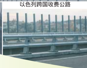
以色列跨国收费公路