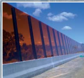
澳大利亚East Link收费公路隔声屏