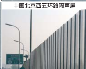
中国北京西五环路隔声屏